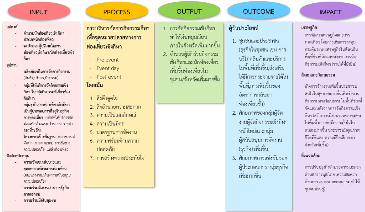
ภาพที่ 2 (sport destination) ที่มีศักยภาพได้แก่ ศิลปะมวยไทย กีฬาวิ่ง และปั่นจักรยาน

งานวิ่งเป็นระยะ ๆ ชุดความรู้ใหม่ที่สมบูรณ์ มีองค์ประกอบหลัก ประกอบด้วย ปัจจัยนำเข้า กระบวนการ ผลผลิต (ภาพที่ 2) การลงทุนในปัจจุบันทั้งหมดเป็นมูลค่ารวมทั้งสิ้น 20,497,900.00 บาท แยกเป็นค่าดำเนินการ 19,315,900 บาท ค่าใช้จ่ายในการประสานงาน 650,000 บาท ค่าตอบแทน 180,000 บาท และ ค่าสนับสนุนภาคี 352,000 บาท ซึ่งการลงทุนนี้ได้มาจาก เงินสนับสนุนจากภาคเอกชน มารารอนจำนวน 16,600 คน ประเภทฮาล์ฟมารารอนจำนวน 5,700 คน ประเภทมินิมารารอนจำนวน ส่วนผลจากการประเมินผลกระทบทางสังคมโดยใช้แนวคิดทางเศรษฐศาสตร์ พบว่า จากผู้เข้าร่วมกิจกรรมทั้งหมดจำนวน 33,200 คน ประเภท 5,800 คน ประเภท 5 กิโลเมตร จำนวน 5,000 คน และประเภท Charity Run จำนวน 100 คน 350,000.00 ค่าสมัคร 24,130,000.00 บาท ค่าตอบแทนอาสาสมัครและค่าใช้จ่ายต่าง ๆ 650,000.00 บาท ค่าจ้าง 19,965,900.00 และ เงินสนับสนุนจากหน่วยงาน/องค์กรต่าง ๆ 7,000,000.00