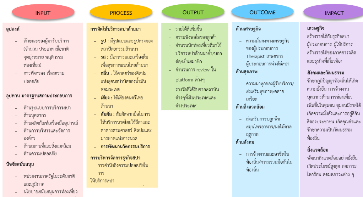
ภาพที่ 3 ชุดความรู้ใหม่เกี่ยวกับการพัฒนาประเทศไทยสู่การเป็นจุดหมายปลายทาง การท่องเที่ยวเชิงสปา (spa destination)

ในด้านกระบวนการ ประกอบด้วย การให้บริการสปาชั้นนำ การบริหารจัดการ และเกณฑ์การรับรองความเป็นชั้นนำ ในด้านผลผลิตประกอบด้วยรายได้จากนักท่องเที่ยวชาวต่างชาติที่มาใช้บริการ รายได้จากนักท่องเที่ยวเพื่อโรงแรม/ที่พัก อาหาร การเดินทางสินค้าอื่น ๆ ความพึงพอใจและจำนวนของนักท่องเที่ยวต่อการใช้บริการสปาชั้นนำ และรายได้ของธุรกิจที่เป็นห่วงโซ่อุปทานของสปาชั้นนำทั้งจังหวัดและในประเทศ ในส่วนของผลผลิต ประกอบไปด้วย ด้านเศรษฐกิจ ด้านสุขภาพ ด้านสิ่งแวดล้อม ด้านสังคม และผลกระทบ ด้านเศรษฐกิจ ด้านสังคมและวัฒนธรรม ด้านสิ่งแวดล้อม สถาบันการศึกษาและภาคีต่าง ๆ (ภาพที่ 3)